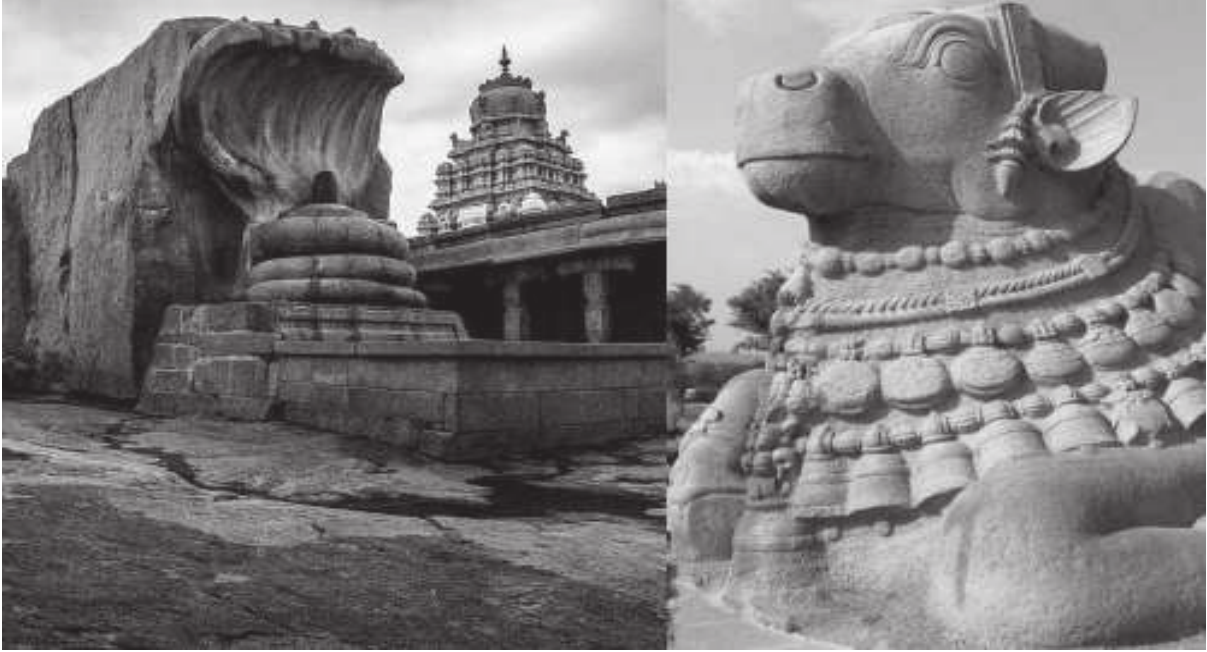
హంపి దేవాలయం, లేపాక్షి