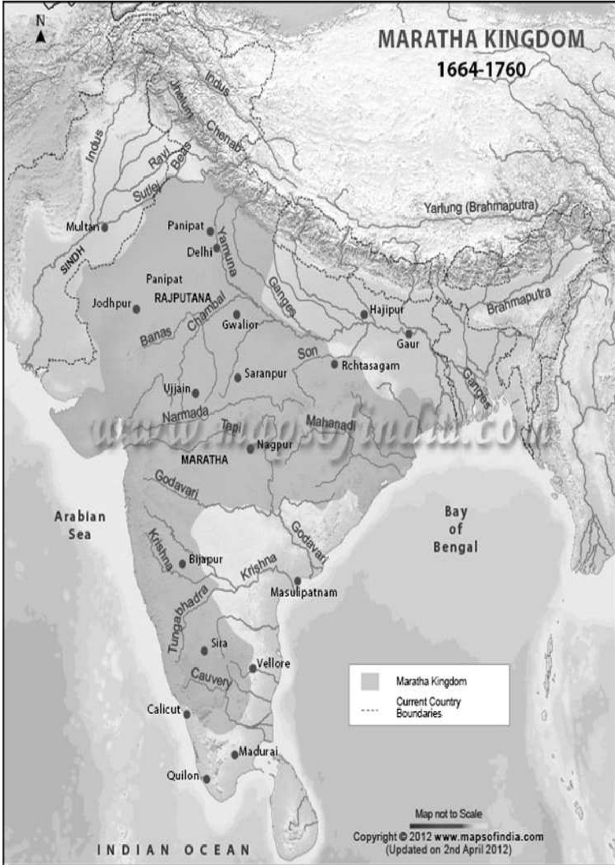
Maratha Kingdom, Shivaji empire Map