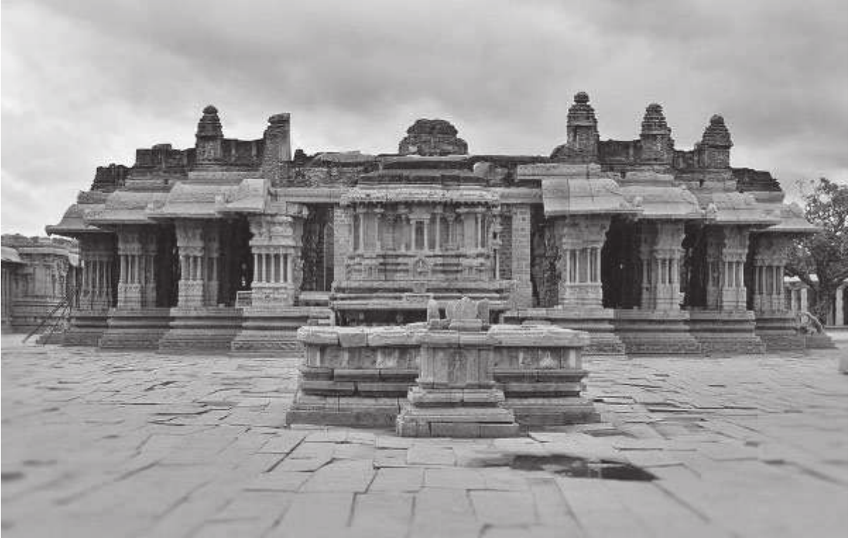
విరుపాక్షా దేవాలయం, హంపి.

దుర్గ నివర్తనం, కావలి కట్టం వంటి పన్నులు కూడా ఉండేవి. అయితే పన్నులు భారం ఎక్కువైనా కరువు కాటకాలు, ప్రకృతి సంబంధమైన సంక్షోభాలు సంభవించి, పంటలు పాడైనప్పుడు రైతులకు పన్నుల భారం ఉండేది కాదని శాసనాలవల్ల తెలుస్తుంది. భూమి శిస్తుతో పాటు అనేక రకాల పన్నులను వసూలు చేయడం జరిగింది. మొత్తం మీద ఈ కాలంలో పన్నుల భారం ఎక్కువే అని చెప్పవచ్చు. తమ ఆదాయాన్ని విద్య, వైద్య సదుపాయాలకు ఖర్చు చేయలేదు. అంతఃపుర ఖర్చు, సైనిక పోషణ, దేవాలయ నిర్మాణాలకు, నీటి పారుదల సౌకర్యాలకు, కళా సాహిత్య పోషణకు, దాన ధర్మాలకు తమ ఆదాయాన్ని వినియోగించేవారు.